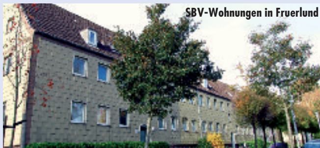
SBV-Wohnungen in Fruerlund

Flensburg - Der Flensburger Selbsthilfe-Bauverein (SBV) plant im Stadtteil Fruerlund eine groß angelegte Sanierung und Modernisierung. Davon sollen rund 900 Wohneinheiten betroffen sein. Von diesen 900 Wohnungen sollen 288 der Abrissbirne anheimfallen. Für den abgerissenen Bestand sollen allerdings nur 208